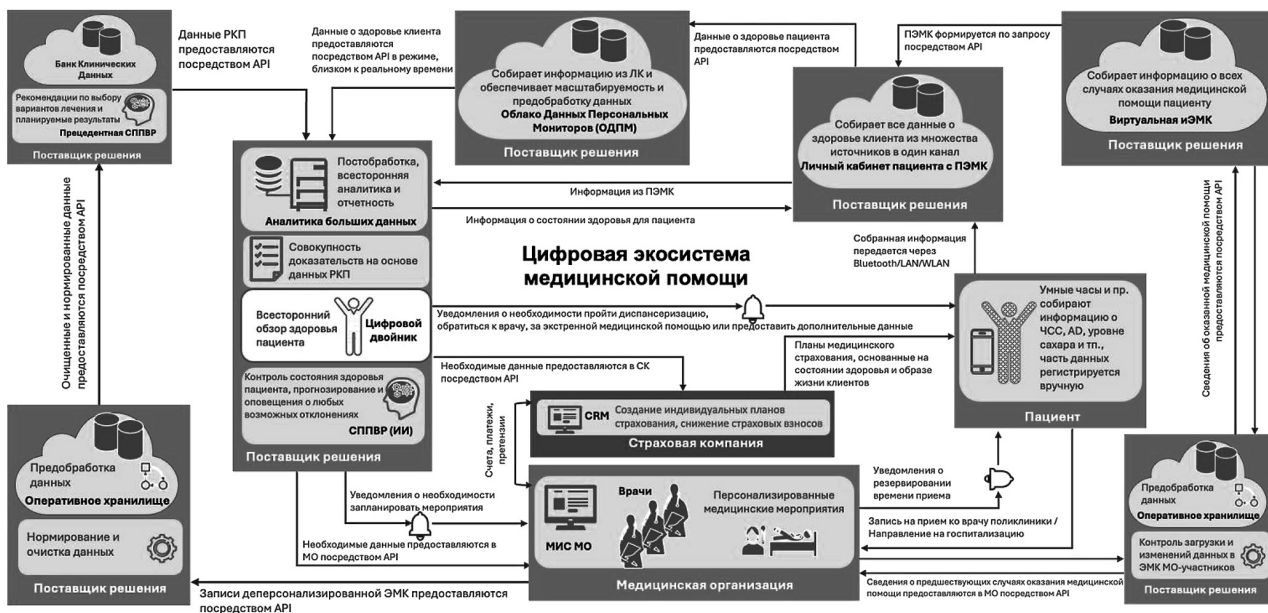
Рис. 3. Технологическая мета-структура цифровой экосистемы медицинской помощи

выбирается в зависимости от решаемых задач и особенностей информационных систем участников экосистемы.